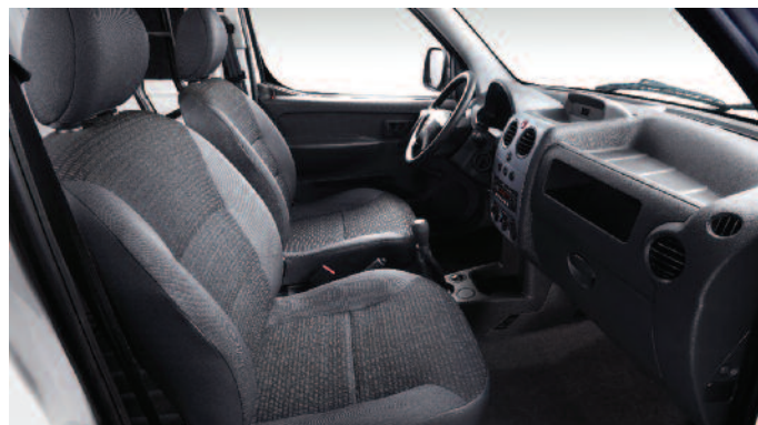
PARTNER FURGÓN Ortal + Omni Serge